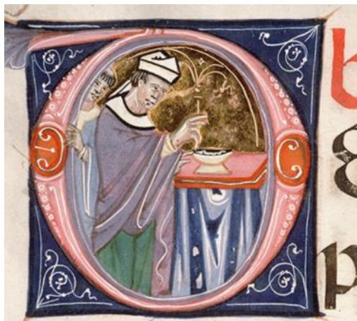
Bénédictio des cendres, enluminure d'un Pontifical romain conservé à Avignon, XIVe s.

Tomber en Carême c'est aussi y entrer en se faisant mal : c'est ne voir dans cette pratique de l'Église que l'aspect désagréable, pénible. N'en considérer que les mortifications par exemple. Carême rime alors avec tristesse et l'on n'y voit, au mieux, qu'un mal nécessaire pour arriver péniblement à Pâques.